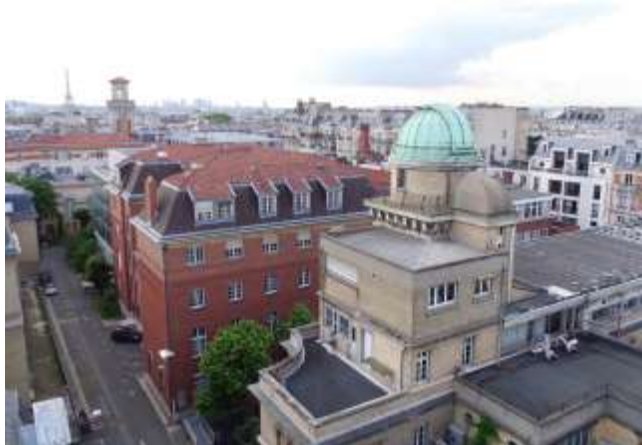
Bâtiments Perrin (avec la coupole) et Borel (brique rouge) / Perrin (with dome) and Borel (red brick) buildings

En 2020 est créée la Maison Poincaré comme 3ème département. Le lieu du même nom accueillant le public ouvrira dans le bâtiment Perrin, ancien laboratoire de chimie physique construit en 1926 et réhabilité pour permettre l'extension de l'Institut Henri Poincaré. Entre 2019 et 2021 le bâtiment Borel est rénové tout en restant occupé.