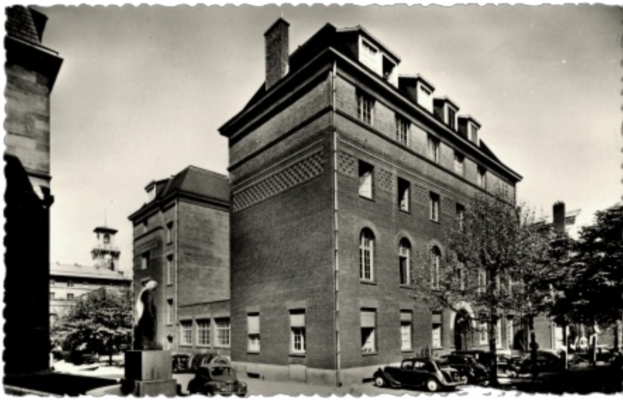
Façade est et sud de l'IHP en 1954 / East and south façades of IHP in 1954

Fondé et bâti en 1928 grâce à des mécènes privés au sein de la Faculté des sciences de l'Université de Paris comme un « centre d'enseignement et de recherches scientifiques sur la physique mathématique et théorique et les sciences connexes, telles que le calcul des probabilités », l'Institut Henri Poincaré est la maison historique des mathématiques et de la physique théorique en France.